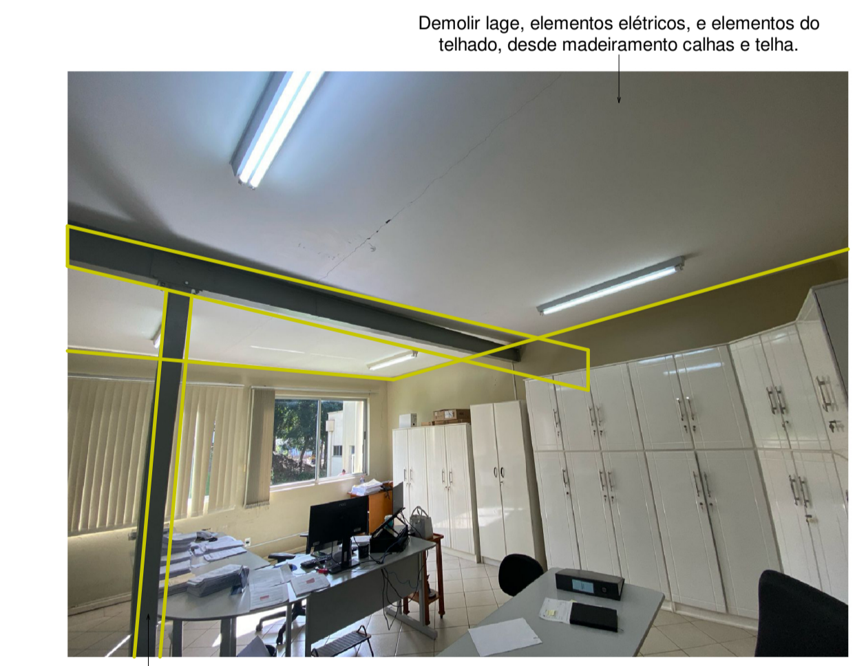
Demolir laje, elementos elétricos, e elementos do telhado, desde madeiramento calhas e telha. Remoção de elemento estrutural