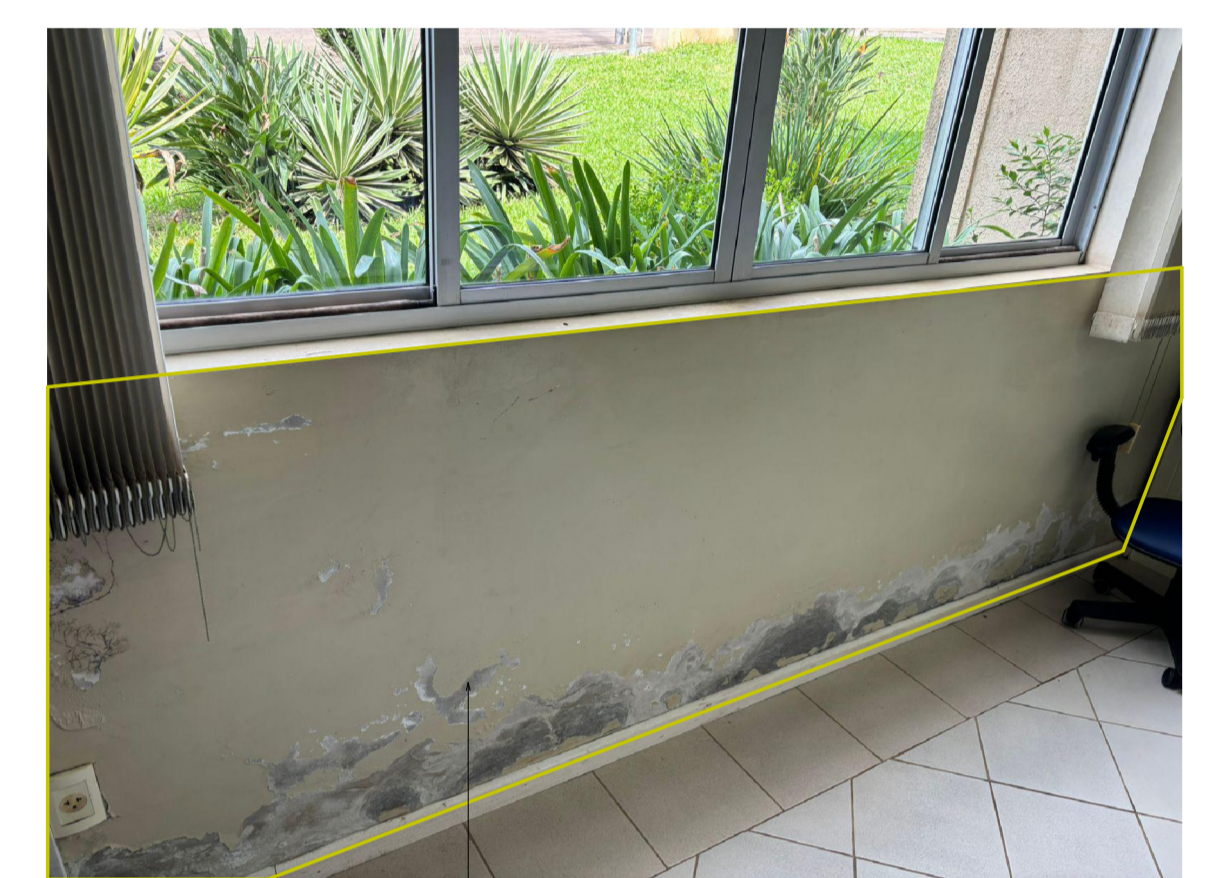
Remoção de elementos da parede até chegar no tijolo.