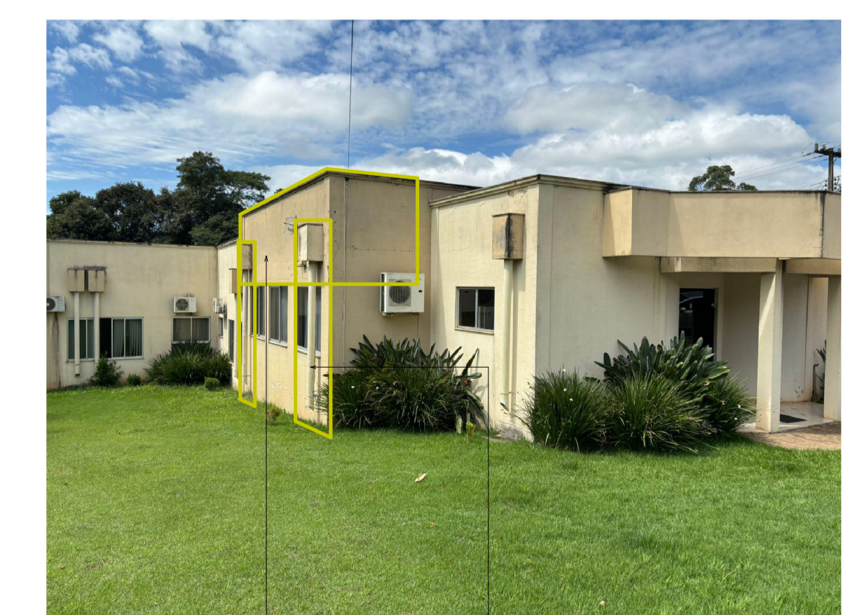
Demolição da parede da platibanda Remoção de elementos pluviais.