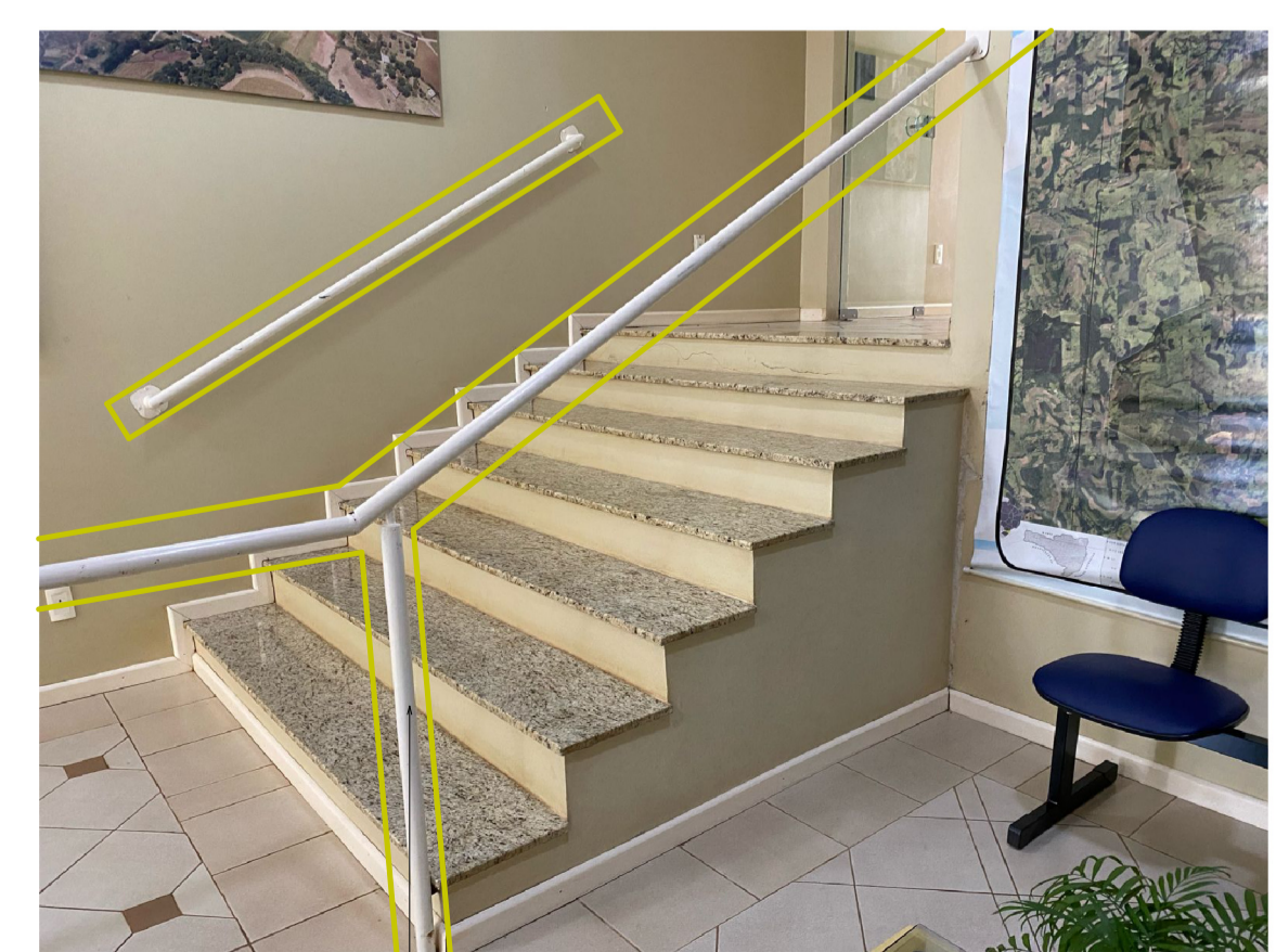
Remoção de guarda-corpo.