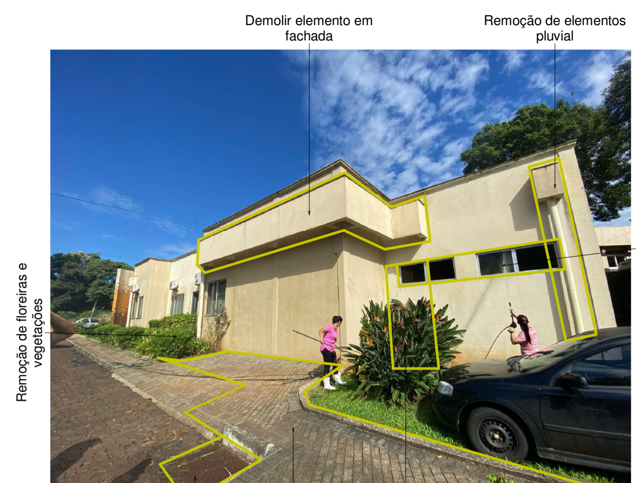
Demolir elemento em fachada Remoção de elementos pluviais Remoção de janela com aproveitamento