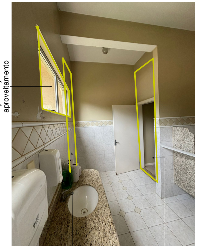
Remoção de janela com aproveitamento Abertura de parede Remoção de Porta e demolição de parede