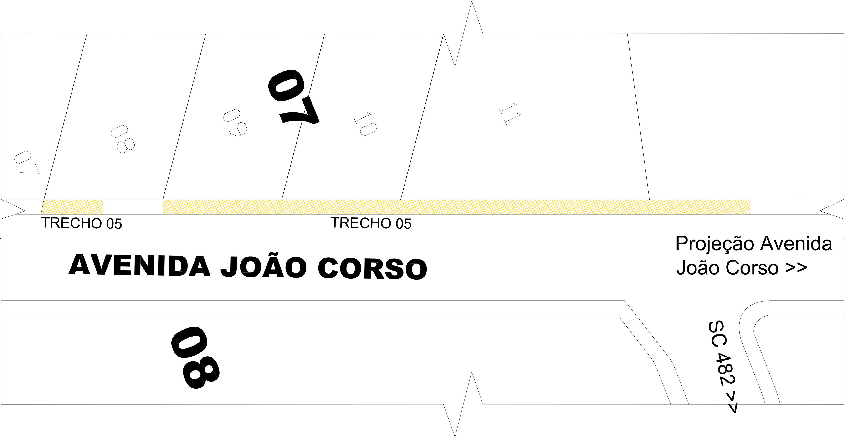
LOCALIZAÇÃO AVENIDA JOÃO CORSO BRUNO A. T. 1.230